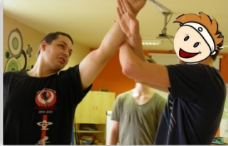
S OKINAWA KARATE KAI PANTER