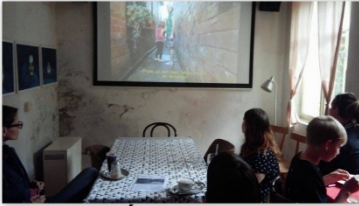
AKTIVNÍ MUZIKOTERAPIE S ORA RANGI