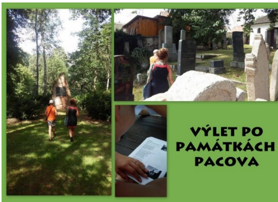
VÝLET PO PAMÁTKÁCH PACOVA