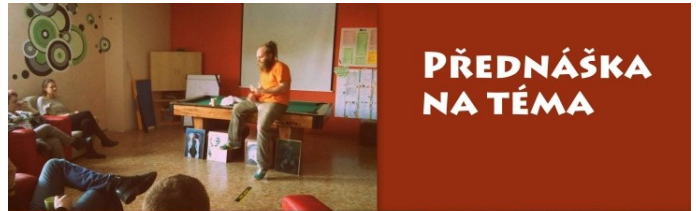
PŘEDNÁŠKA NA TÉMA